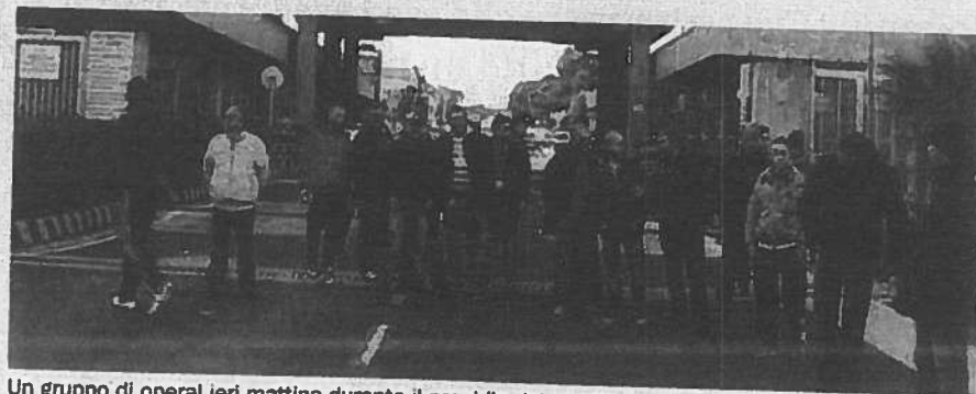
Un gruppo di operai ieri mattina durante il presidio dei varchi di accesso alla raffineria

A Palermo, intanto, sale la tensione tra gli operai della Fincantieri. Mentre ieri protestavano si è sparsa la notizia che 130 hanno ricevuto una lettera di avviamento alla cassa integrazione per due anni. > PAG. 22