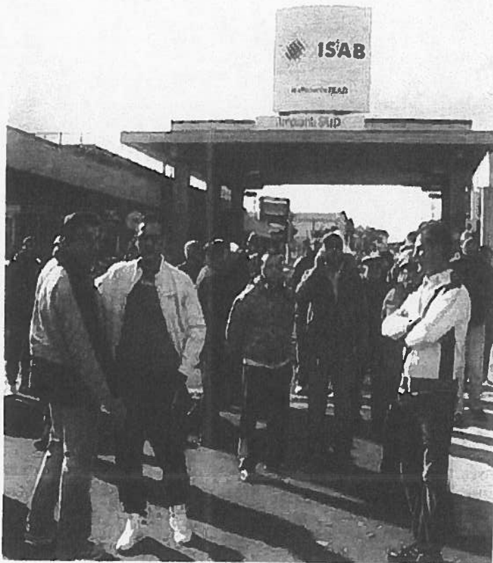
Un momento del presidio dei cancelli della raffineria

Nel frattempo gli appelli alla Regione si sono sprecati. Sono stati lanciati in tutte le forme e in tutte le occasioni possibili e immaginabili. Lo scorso ottobre forze sociali e istituzioni hanno sfilato in corteo per le vie della città, fianco a fianco, ma è stato tutto inutile. La tanto attesa firma sull'autorizzazione unica per la costruzione dell'impianto non viene ancora apposta.