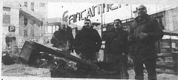
Lavoratori della Fincantieri davanti al cancello della fabbrica

Fincantieri, tute blu in piazza in attesa della mediazione della Regione